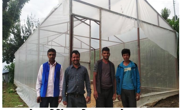
तरकारी ब्लक विकास कार्यक्रम अन्तर्गत किस्पाड-२, नुवाकोटमा निर्मित प्लाष्टिक घरहरूको झलकहरू