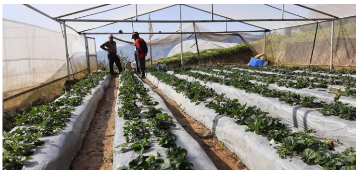
कृषकको फार्महरूमा जिल्ला समन्वय अधिकारी र केन्द्र प्रमुखबाट गरिएको भ्रमण तथा अनुगमनका झलकहरू