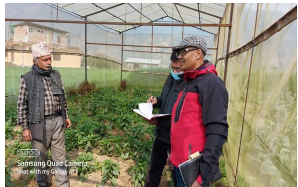
कृषि ज्ञान केन्द्रको प्रमुख सहित PMAMP PIU NUWAKOT र PMAMP KUMALTAR का प्राविधिकहरुबाट तरकारी ब्लक पकेट कार्यक्रमको अनुगमनका झलकहरु