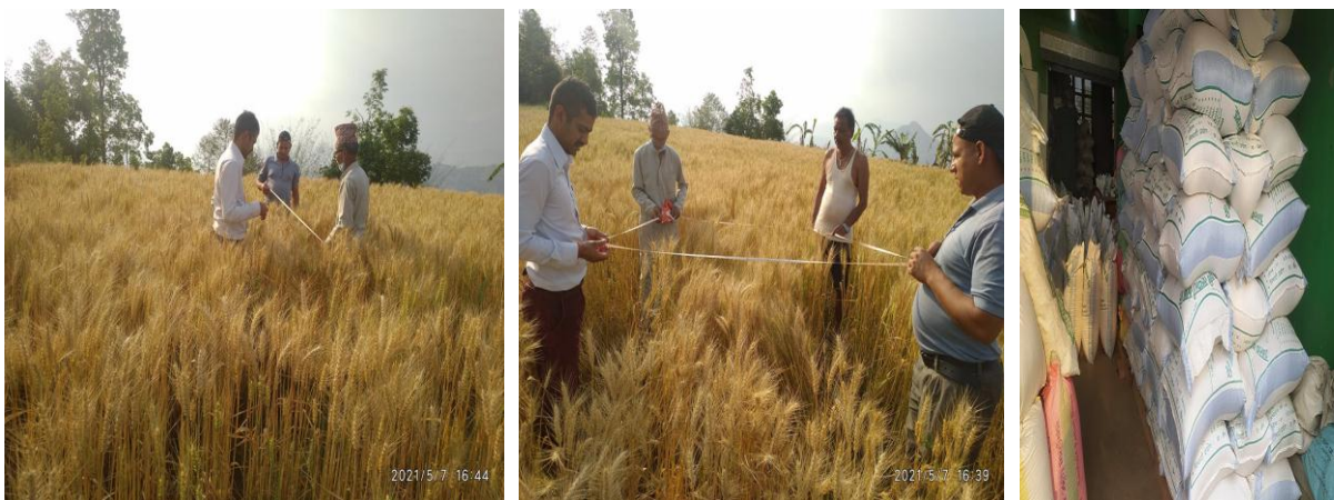
उन्नत बीउ उत्पादन तथा प्रवर्द्धन कार्यक्रममा रु. २०/के.जी.का दरले प्रोत्साहन रकम कार्यक्रम अन्तर्गत शिवपुरी-८, नुवाकोटमा संचालित कार्यक्रमको झलकहरु