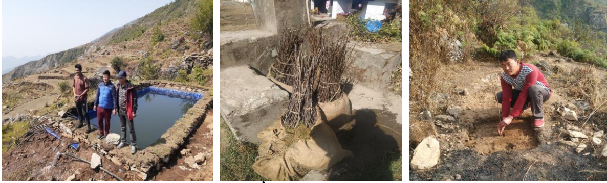
स्याङ ब्लक विकास कार्यक्रम अन्तर्गत नौकुण्ड-१,६, रसुवामा संचालित कार्यक्रमहरुको झलकहरु