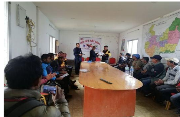
कृषि यन्त्र मर्मत तालिमको झलकहरू