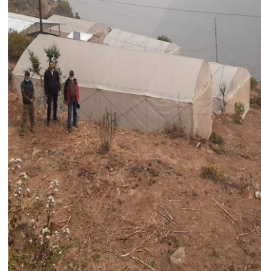
गत आ.व.मा संचालित एक निर्वाचन क्षेत्र एक मोडेल फार्म विकास तथा विस्तार कार्यक्रमको निरन्तरता कार्यक्रमको झलकहरु (एपी एग्रो रसुवा, गोसाईकुण्ड-६, रसुवा)