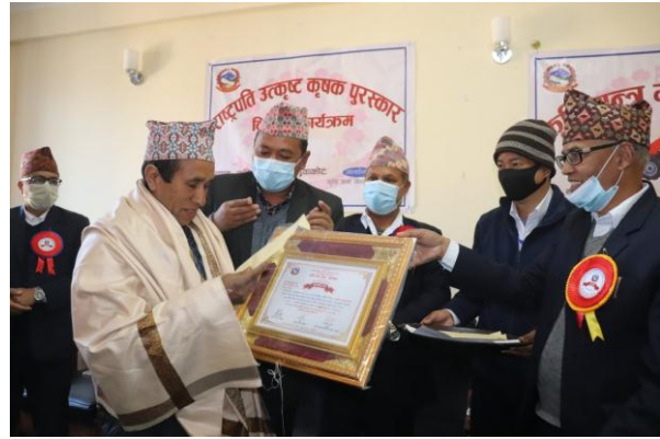
नुवाकोट जिल्लाका कृषकहरूलाई राष्ट्रपति उत्कृष्ट कृषक पुरस्कार वितरण कार्यक्रमको झलकहरू