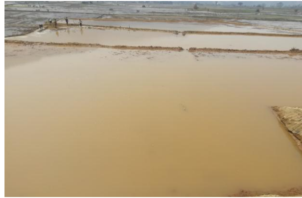
सामुहिक खेति व्यवस्थापन समिति, लिखु-पन्चकन्या, नुवाकोट कार्यक्रमको निरन्तरताका लागि अनुदान कार्यक्रममा संचालित कार्यक्रमहरुको झलकहरु