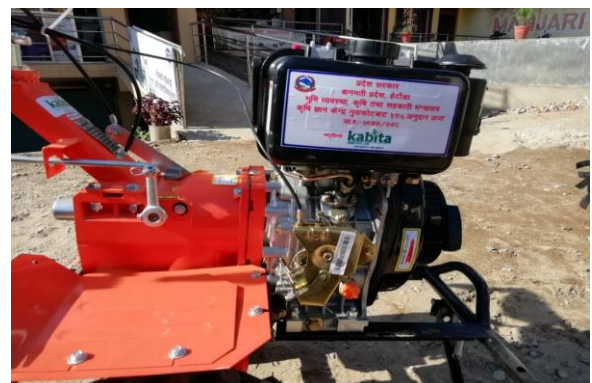
कृषि ज्ञान केन्द्र, नुवाकोटद्वारा ५० प्रतिशत अनुदानमा साना कृषि औजार वितरण कार्यक्रमको केहि झलकहरु