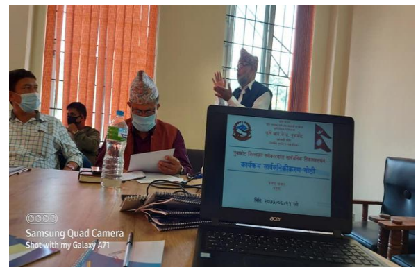
नुवाकोट जिल्लाका सरोकारवाला सार्वजनिक निकायहरूसँग कृषि ज्ञान केन्द्र, नुवाकोटले गरेको कार्यक्रम सार्वजनिकीकरण गोष्ठीको झलकहरू