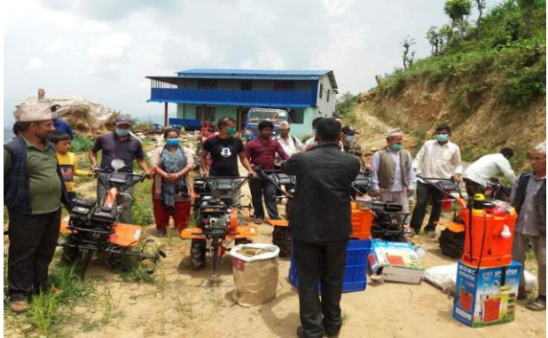
तरकारी ब्लक विकास कार्यक्रम अन्तर्गत बेलकोटगढी-१२, १३, नुवाकोटमा संचालित कार्यक्रमहरूको झलकहरू