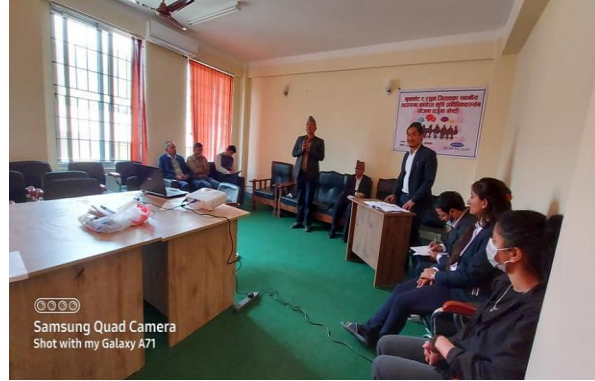
नवाकोट र रसुवा जिल्लाका स्थानीय तहहरूमा कार्यरत कृषि प्राविधिकहरूसँग योजना तर्जुमा गोष्ठीको झलकहरु