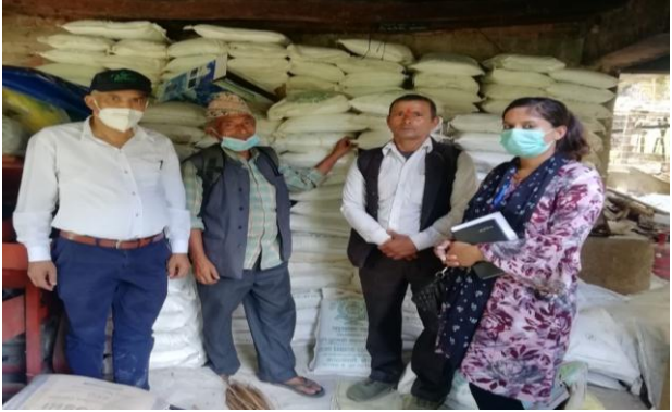
तरकारी ब्लक विकास कार्यक्रम विदुर-३, ९, नुवाकोटमा कृषकलाई वितरणको लागि कृषि चुन, वीउ विजन लगायतका उत्पादन सामग्रीहरूको झलकहरू