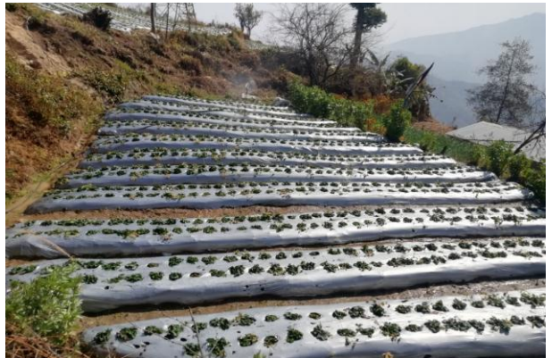
स्ट्रबेरी ब्लक विकास कार्यक्रम अन्तर्गत ककनी-२, नुवाकोटमा ब्लक सञ्चालन समन्वय समिति गठन तथा स्ट्रबेरी उत्पादन क्षेत्रको झलकहरू