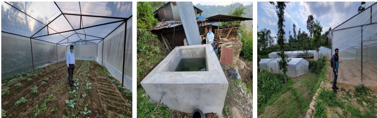
तरकारी ब्लक विकास कार्यक्रम अन्तर्गत कालिका-१,२,३,५, रसुवामा संचालित कार्यक्रमहरुको झलकहरु