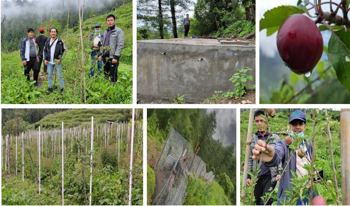
बृहत्तर स्याउ विकास तथा विस्तार कार्यक्रम अन्तर्गत कालसाड कृषि फार्म, गोसाईकुण्ड-५, रसुवामा संचालित कार्यक्रमहरुको झलकहरु